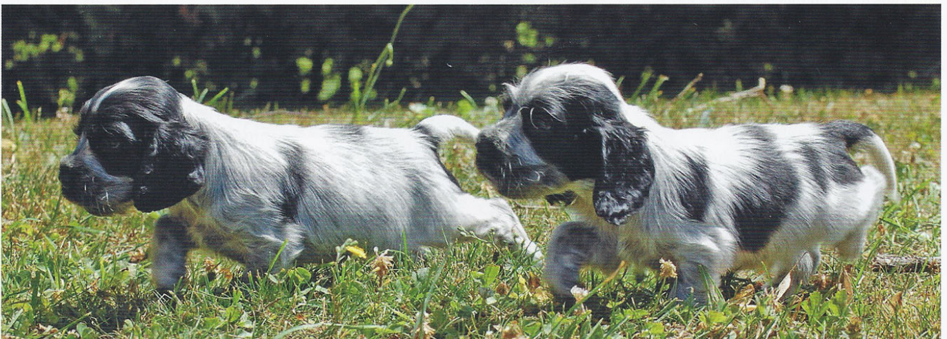
Elevage de Syringa, Chenil de la Maison-Rouge.