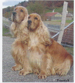
Elevage de Syringa, Chenil de la Maison-Rouge.