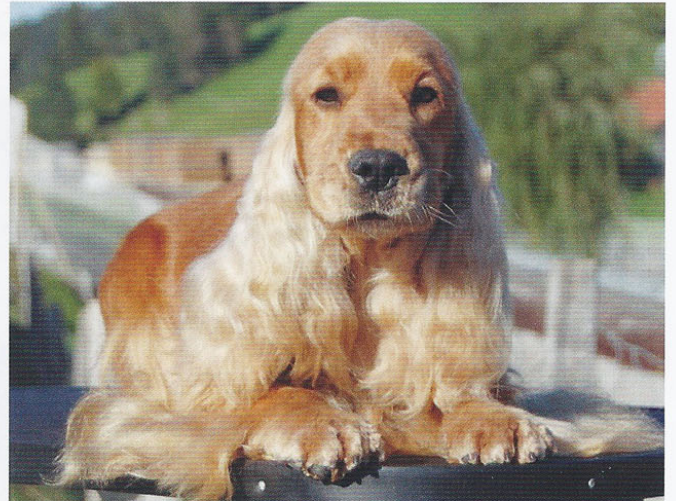
Elevage de Syringa, Chenil de la Maison-Rouge.