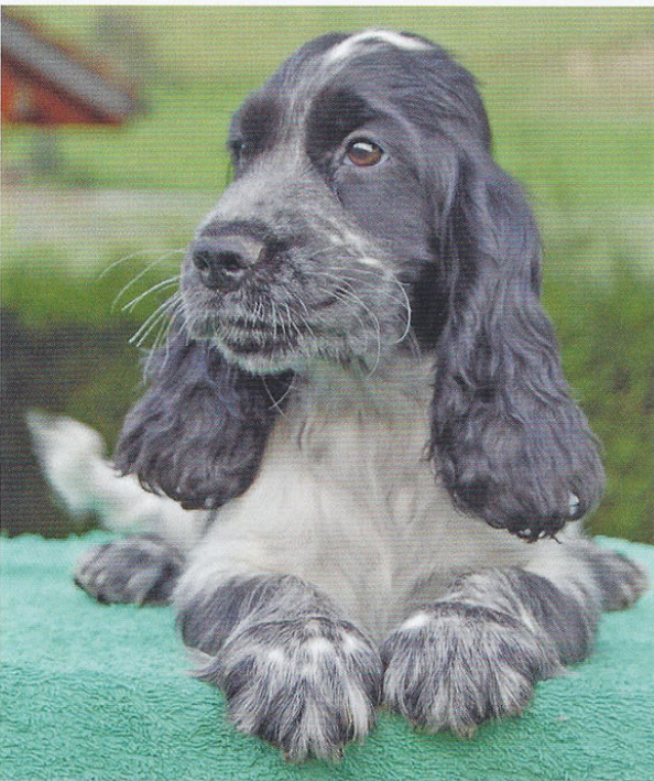
Elevage de Syringa, Chenil de la Maison-Rouge.