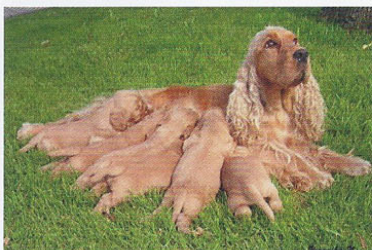
Elevage de Syringa, Chenil de la Maison-Rouge.