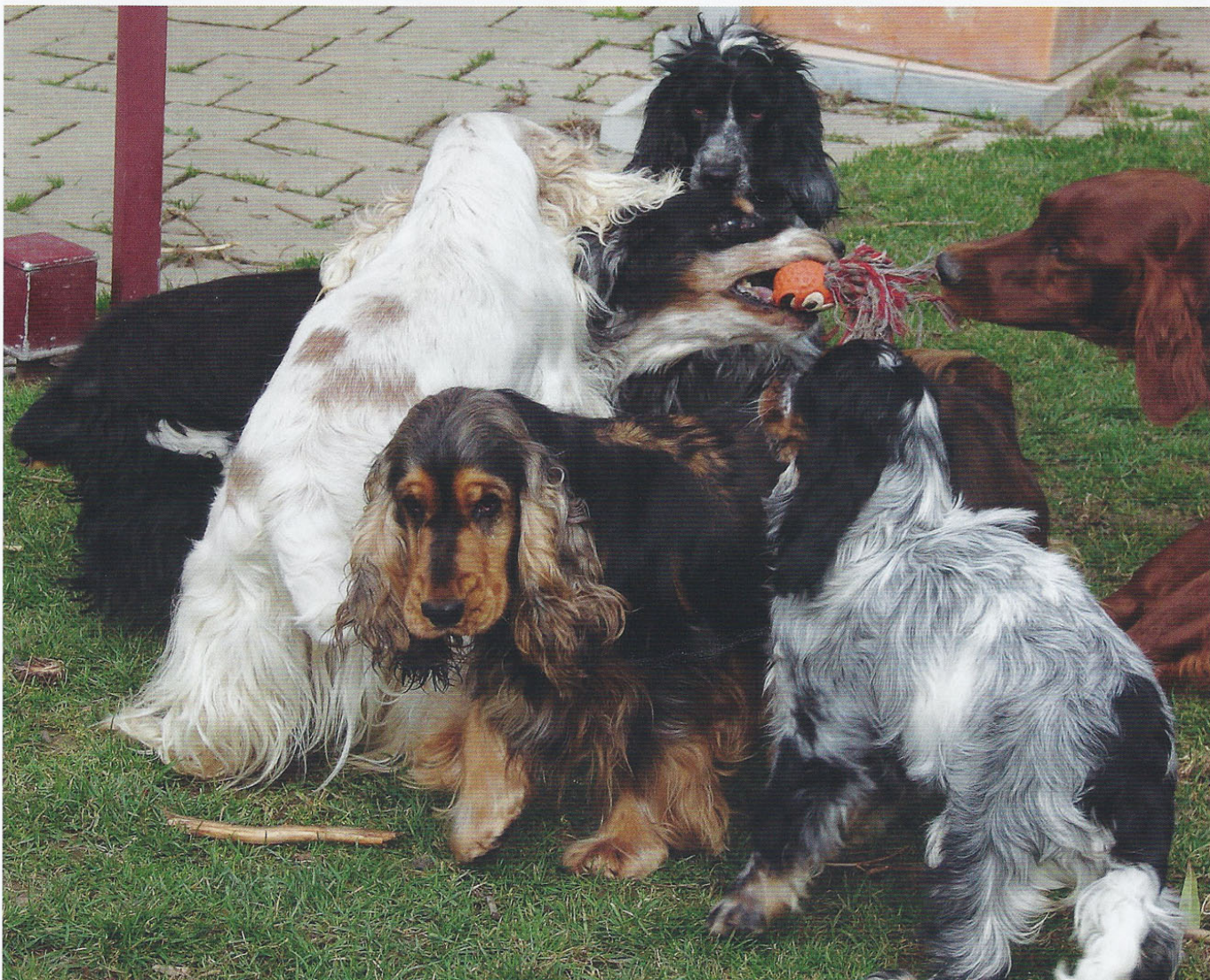
Elevage de l'Etang aux Libellules.