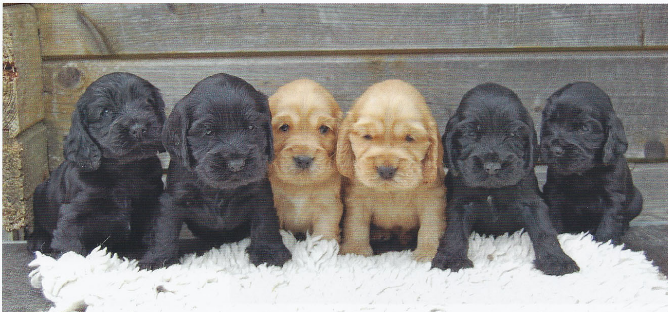
Elevage de Syringa, Chenil de la Maison-Rouge.