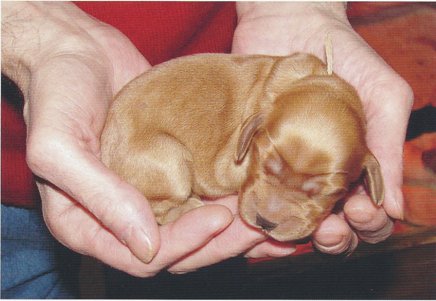
Elevage de l'Etang aux Libellules.