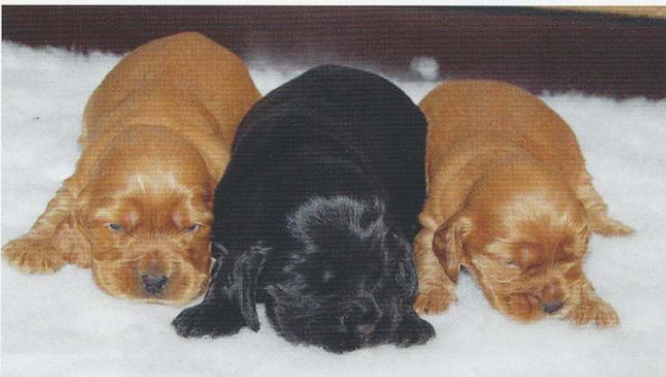
Elevage de Syringa, Chenil de la Maison-Rouge.