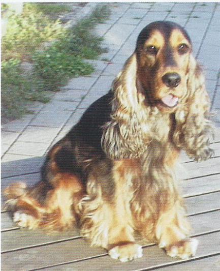
Elevage de l'Etang aux Libellules.

Leur indéniable beauté leur a valu un large succès. En 2012, les Anglais ont modifié le standard. Alors que le texte précédent ne mentionnait que «couleurs variées», le standard actuel donne une liste de couleurs admises, parmi lesquelles ne figure pas le zibeline, pratiquement inconnu Outre-Manche. C'est étonnant qu'une couleur soit ainsi exclue, alors qu'elle ne pose pas de problème, ni de santé ni de comportement. Il y a eu une levée de boucliers, principalement en Allemagne, mais la situation est encore confuse et différente selon les pays. En Suisse, les Cockers zibeline peuvent participer aux expositions mais sans pouvoir accéder au podium. Les sujets qui ont été sélectionnés pour l'élevage avant l'entrée en vigueur du standard, le 1 er janvier 2013, peuvent reproduire. Les chiots qui seraient de cette couleur auront un pedigree, mais ne pourront pas être sélectionnés pour l'élevage. Certains pensent que cette injustice pourrait être corrigée dans les années à venir. Donc, affaire à suivre.