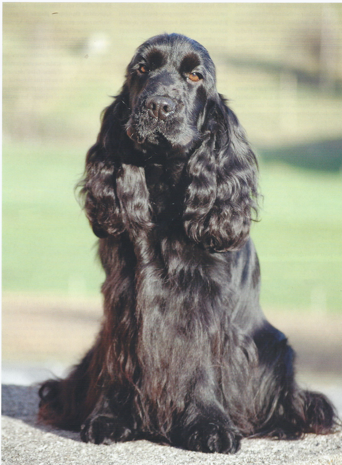
Elevage de Syringa, Chenil de la Maison-Rouge.