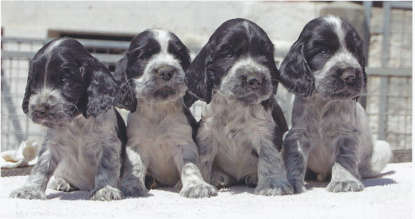
Elevage de Syringa, Chenil de la Maison-Rouge.